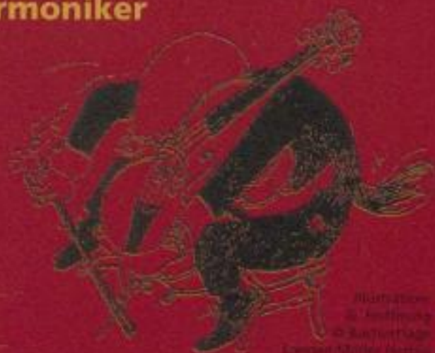
Illustration: © Antje © Antje © Antje

kulinarische Kostbarkeiten im sächsischen Gewande