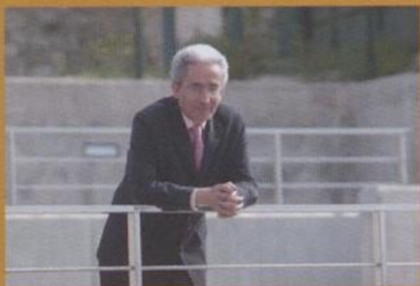
Juan Carlos Aparicio Alcalde de Burgos