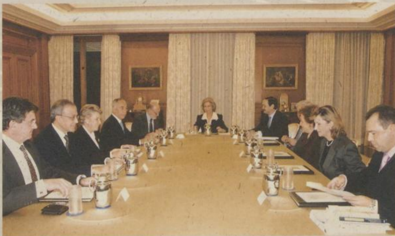
Patronato de la Fundación Reina Sofía

CONCIERTO BENÉFICO 18 | "PROYECTO ALZHEIMER"