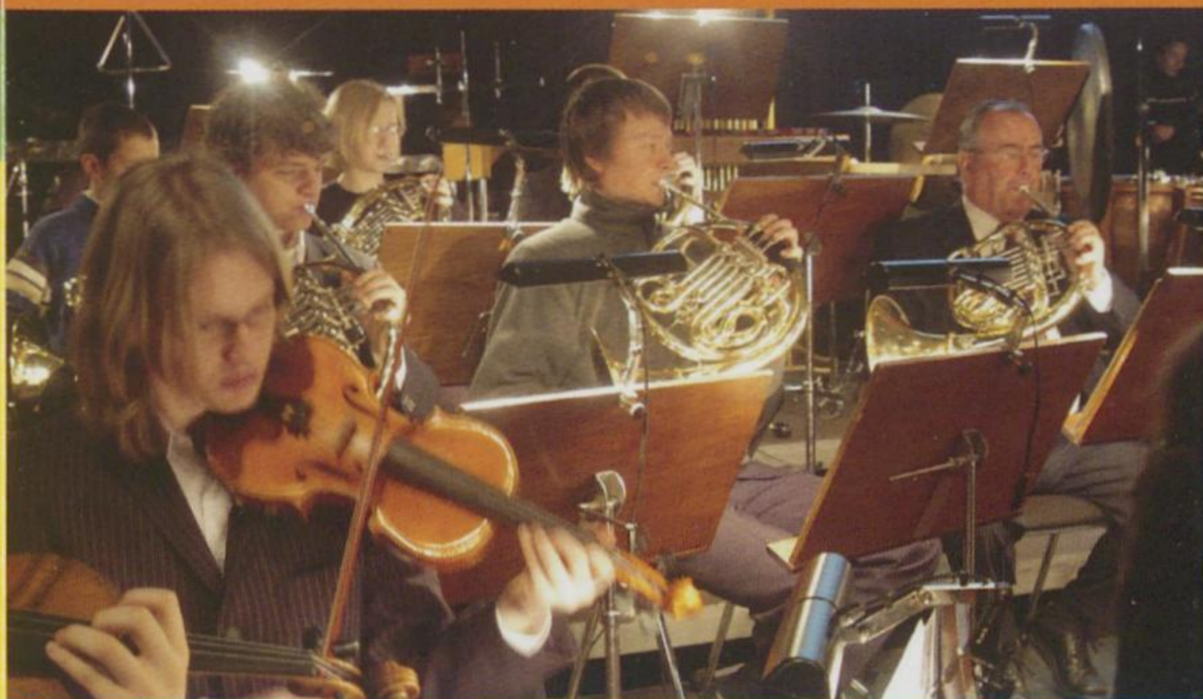
© Grafikstudio Hoffmann 4/08 - Illustration Ohrwurm; Oliver Wilsing