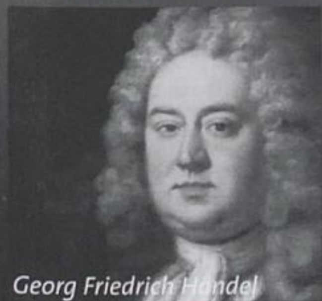
Georg Friedrich Händel

„Matthäuspassion“ für Soli, zwei Chöre, zwei Orchester und Generalbass, BWV 244