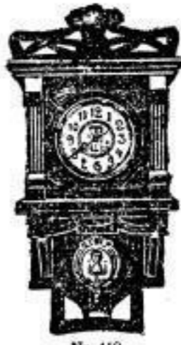
Nr. 410 M. 18.—

Diese Uhren sind echt Nussbaum poliert, 75—95 cm lang, 1a Werke, 14 Tage gehend, mit schönem Schlag.