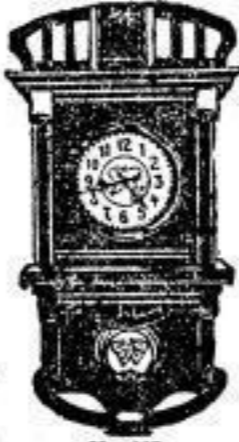
Nr. 205 M. 18.—