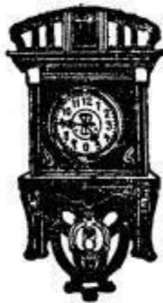
Nr. 115 M. 16.—