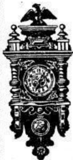
Nr. 100 M. 12.—