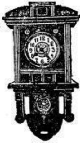
Nr. 204 M. 18.—