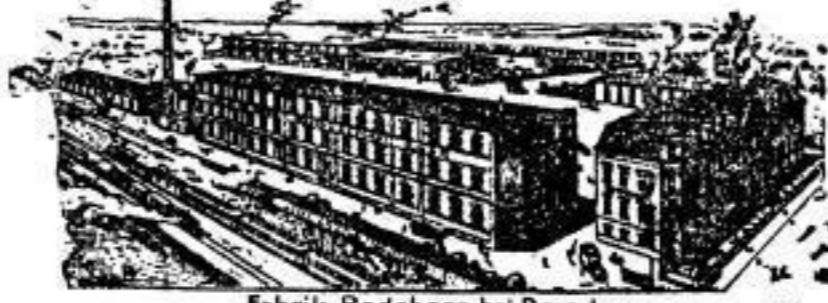
Fabrik Radeberg bei Dresden.