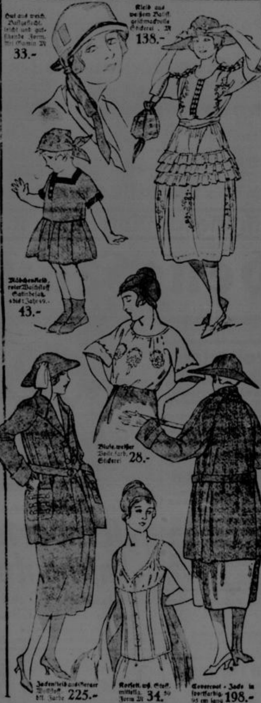
Dul auf weich, Pulloverkleid, leicht und gut, leichte Form, bei 33.-