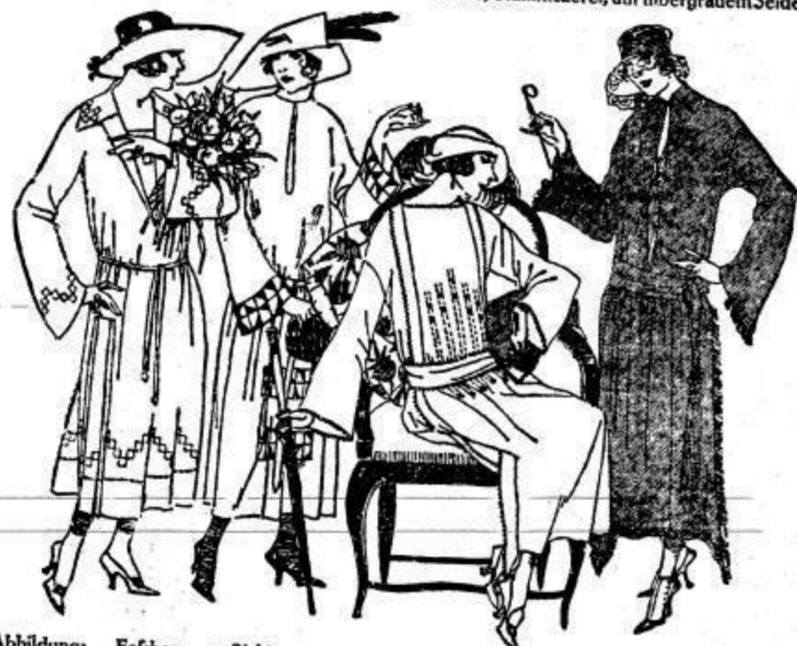
1. Abbildung: Feiches, geflicktes Wollkleid aus vorzüglichem Cheviot 900 3. Abbildung: Elegantes Modell aus Woll-Trikotie, reich bestickt 1650

Neueste wollene Trikot-Jumper 385 525 625 700 bis 1100