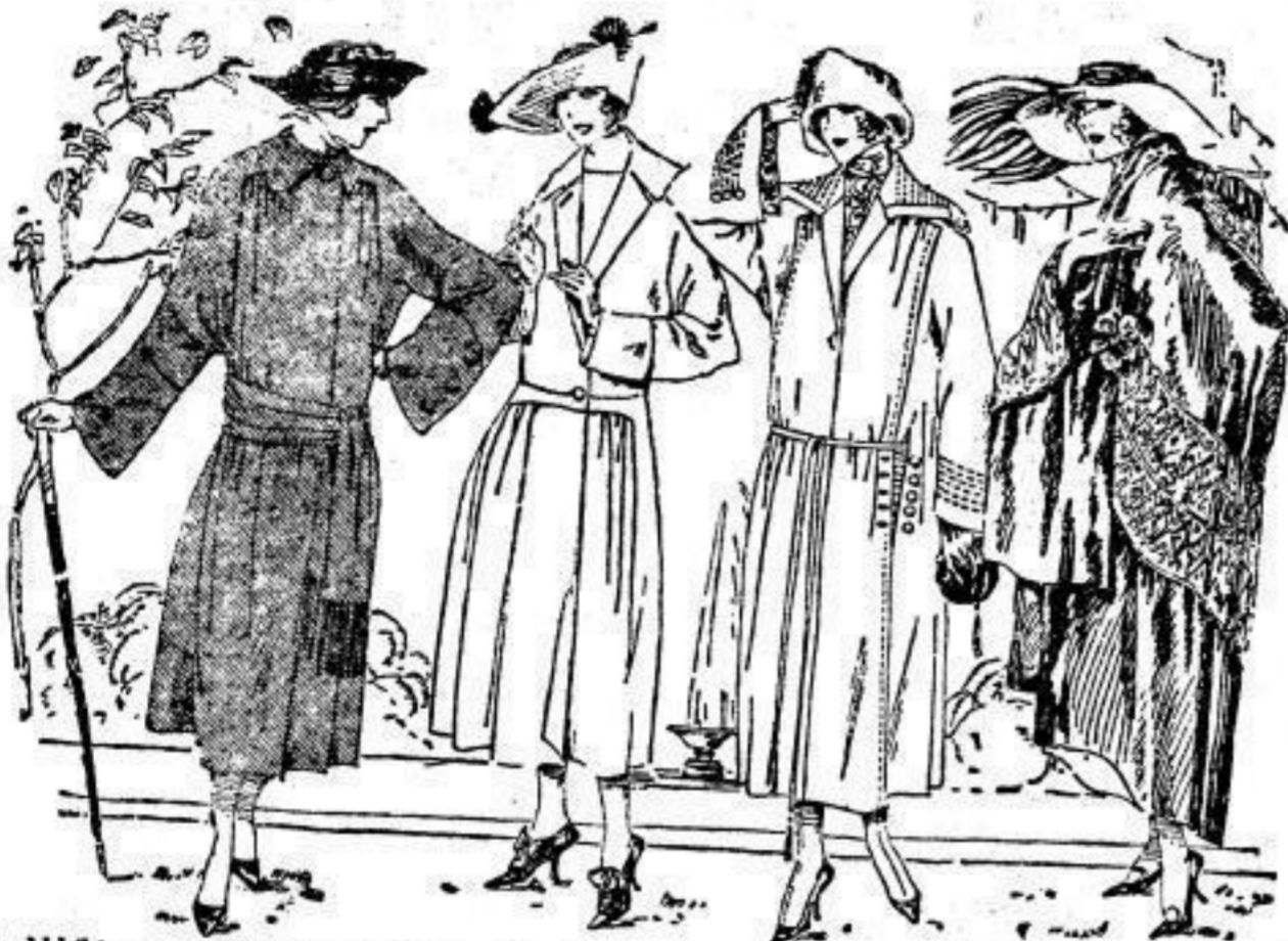
1. Abbildung: Vornehmer Tuch-Mantel mit breitem Schärpengürtel, neuere Modellform. 3. Abbildung: Eleganter Tuch-Modell-Mantel, neuere Form, reich geflickt, auf bester Seide.