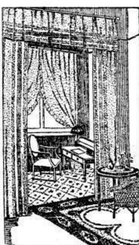
Tüllgarnitur, sorgfältige Mitte, schmale feine Kante... M 26.- Spannstoffe, Wandmuster, beidseitig zur Anfertigung von Scheibenschleiern geeignet, 130 cm breit, M 3.50