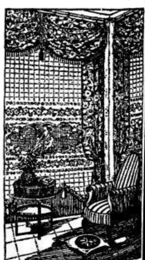
Halbstores, kariert, Ciemin, mit breitem Einsatz in gewebtem Tüll, besonders preiswert... M 10.50 Madrasstoff, schwarzer Grund, farbig gemustert, 130 cm breit... Meter M 5.-

Begründet 1854 / Im alleinigen Besitz von Martin Renner und Familie / Unsere Versandabteilung erledigt für Auswärtige alle Bestellungen