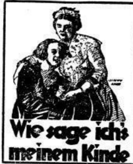
Wie sage ich's meinem Kinde

Mit ungeheurer Wucht rollt die Handlung dieses Films vor unsern Augen ab und zeigt uns, wie eine falsche sexuelle Aufklärung den Gang des Lebens beeinflusst. Weder Wedekind noch Strindberg vermochten durch ihre Werke dieses Thema so klar vor Augen zu führen, wie es dieser Film tut.