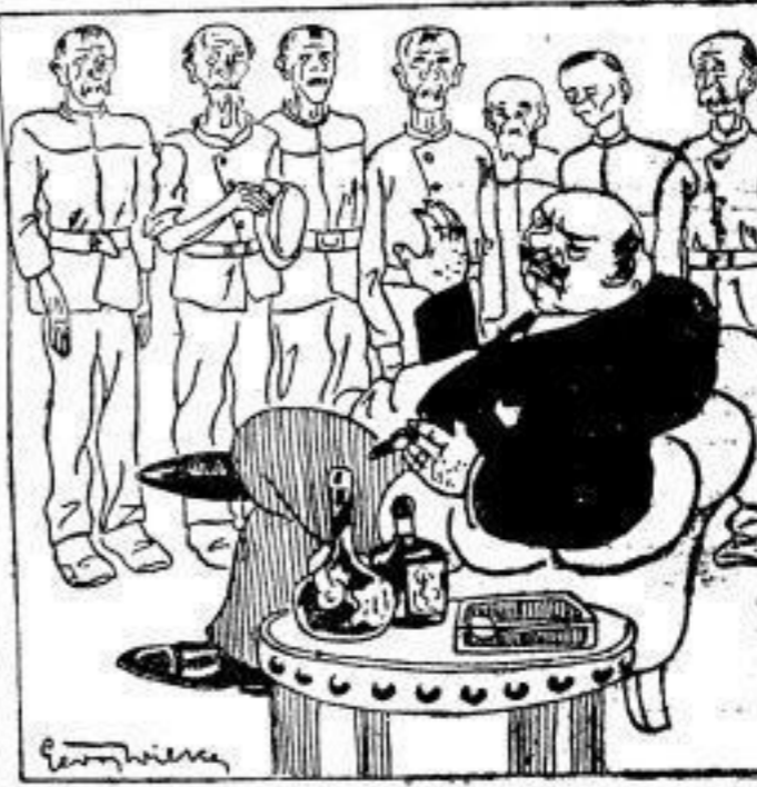
Was, siebenstündige Arbeitszeit unter Tage? Glaubt Ihr, wir hätten die Nationalliberale Vereinigung, den Klub der Generaldirektoren, nur zum Spaß gegründet?