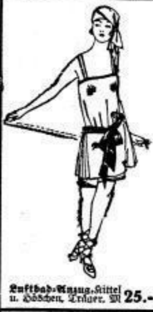
Luftbad-Anzug, Mittel u. Köchen, Tricot, M 25.-

Renner's Wäsche-Abteilung birgt eine Fülle leicht- und waschechter Badeanzüge, Mäntel, Frottiertücher, Hauben und Mützen, und zwar in den verschiedensten Ausführungen. Ein Rundgang in unserem großen Wäschelager wird Sie sofort von der fast unbeschränkten Leistungsfähigkeit dieser Abteilung überzeugen. Auch hier sind die Preise im Vergleich zur Güte des Gebotenen außerordentlich niedrig gehalten, um der Allgemeinheit Gelegenheit zu günstigem Einkauf zu geben.