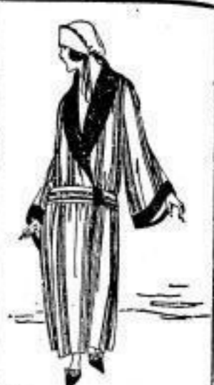
Bademantel für Damen, buntgefärbt, Strickstoff, M 35.-