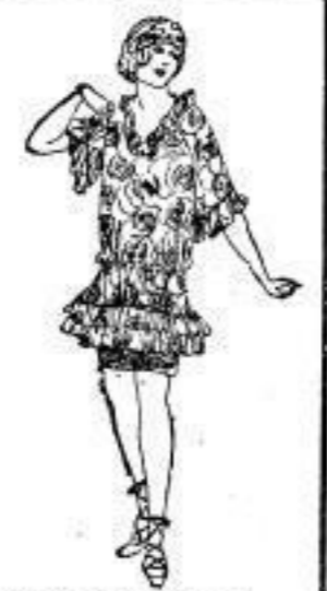
Luftbad-Anzug, Mittel u. Köchen, Satin, M 53.-