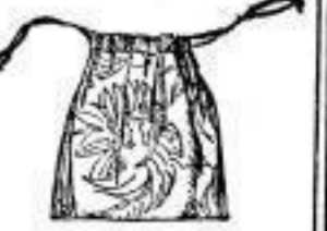
Schwammbeutel, färb. Satin, mod. garniert, M 1.40