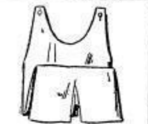
Badetrikot für Herren, schwarz u. marine, M 3.80