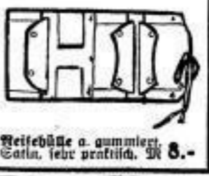
Reisebühle a. gummiertem Satin, sehr praktisch, M 8.-