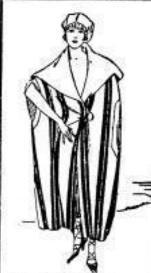
Badecape für Damen, Strickstoff, in gr. Stran., M 28.-