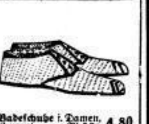
Badeschuh für Damen, Gummi, M 5.20, 4.80