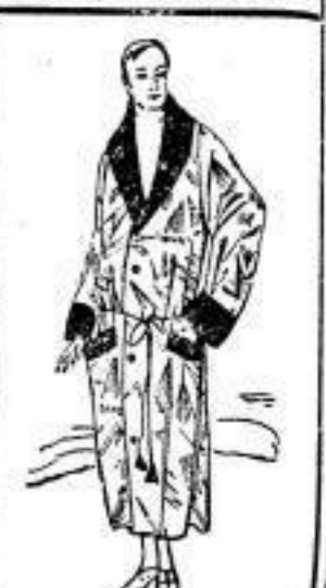
Bademantel für Herren, dunkelblau, Strickstoff, M 48.-