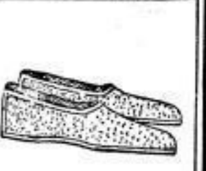
Badeschuh für Damen und Herren, M 4.76, 3.20