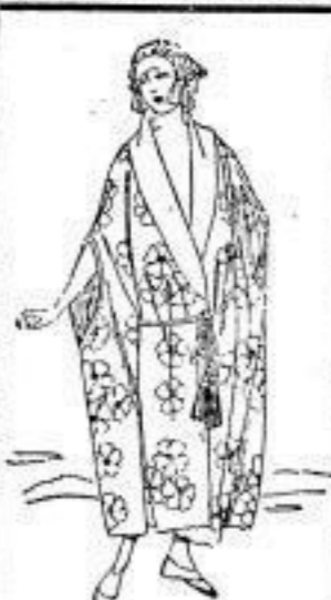
Badecape für Damen, vorzügl. Jacquardstoff, M 57.-