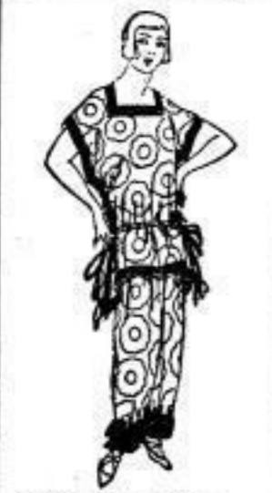
Luftbad-Anzug, Strickstoff, Mittel u. Köchen, M 50.-