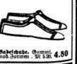
Badeschuh, Gummi, mod. Formen, M 5.20, 4.80

Unsere Kredit-Abteilung bietet erleichterte Zahlungsbedingungen / Auskunft: Rechnungs-Abt., I. Stock