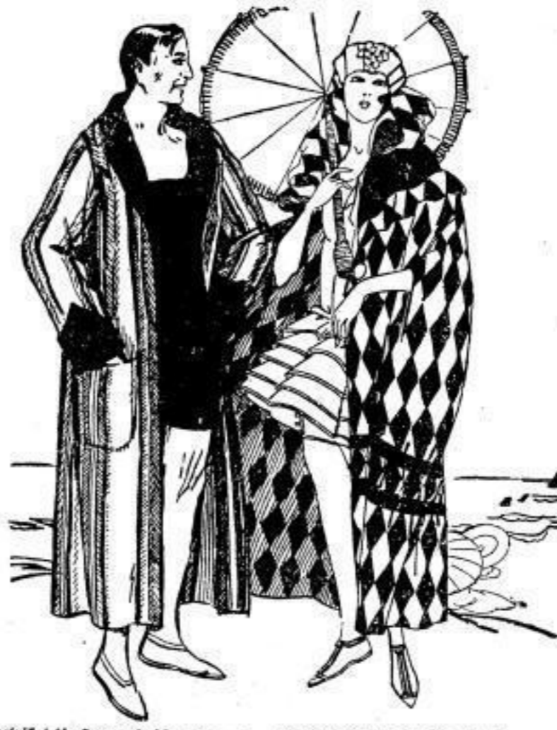
Badetrikot für Herren, in schwarz, gute Qualität, M 3.60 Bademantel für Herren, prima Strickstoff, mit Römerstreifen, M 57.- Badeschuh in farbigen Gummi, in verschiedenen Größen, M 4.76 Badehose für Herren, in Kessel, besonders preiswert, M -65