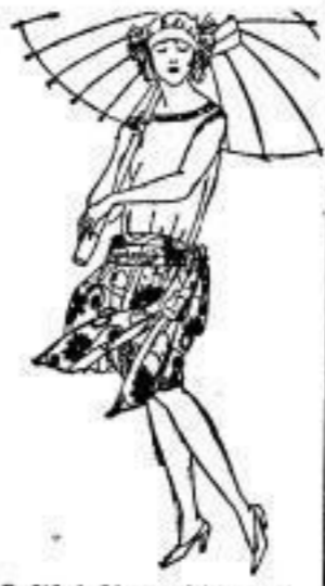
Luftbad-Anzug, leichte Form, schwarz Satin, M 32.-