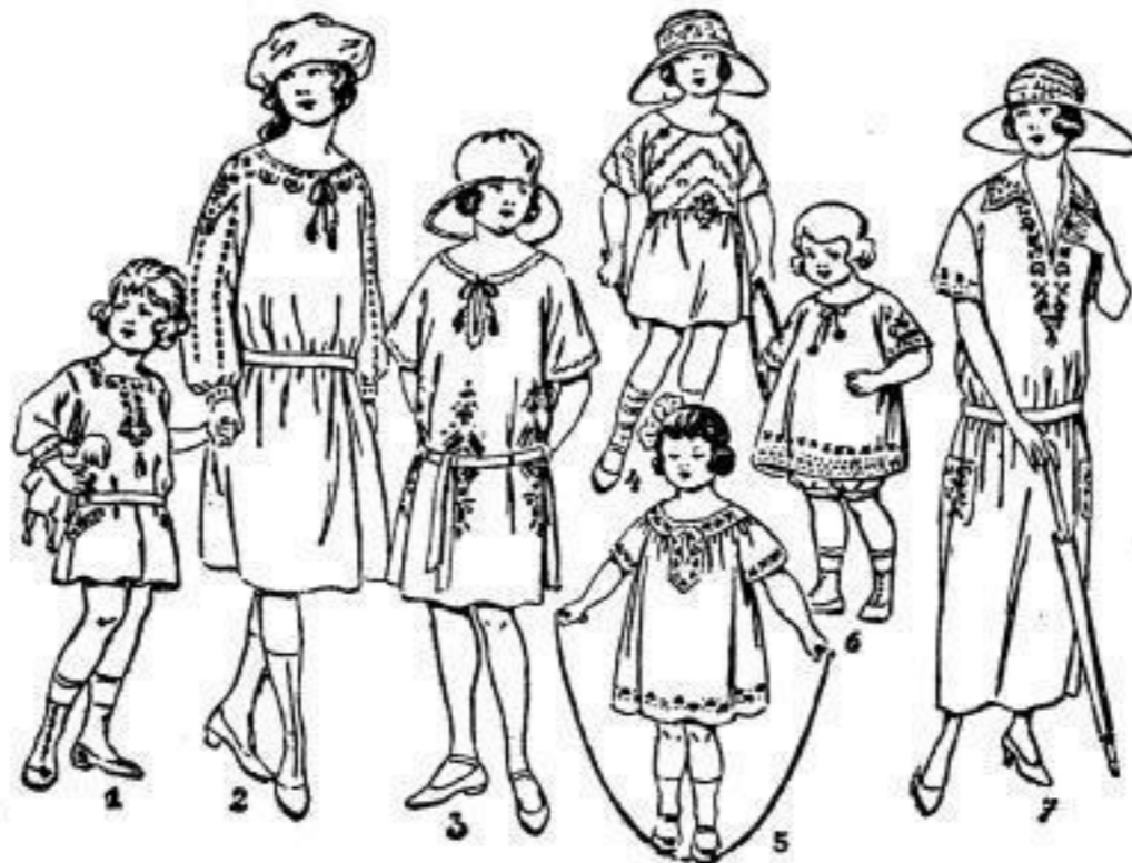
Abb. 5 „Dotty“ Baby-Hängerrh. m. mehrfarb. bunt. Stickerei, 45 cm lang 8.25 (jede weitere Größe 75 A Steigerung)

Abb. 4 „Erna“ Babykleid, reiz. Taillenform, reich bestickt, 45 cm lang 8.25 (jede weitere Größe 75 A Steigerung)