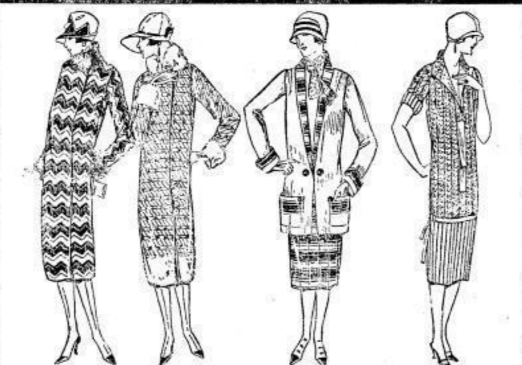
Strickmantel für junge Damen in profiblen Farben, mit Wollepelztragen u. Wulsen, schmale Ärmel, bestes Material, M 29.75 Strickmantel, fein gewirkt, Kragen, Manschetten und Ärmel von zartem, schmalen, schmalen, schmalen, schmalen, M 39.- Strickjacke, feiner, in rot u. dunkelrot, sehr fein gewirkt, sehr fein gewirkt, M 25.- Strickkleid, mit und ohne, weiches, zusammengepfeilt, feiner Schnitt, bestes Material, M 28.-