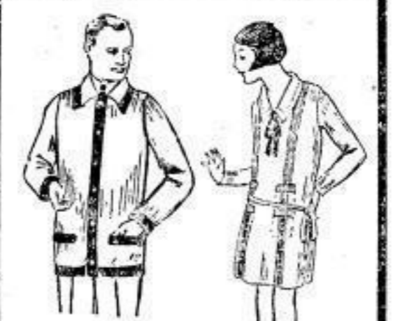
Klubjacken, reine Wolle, mit Besatz, 2 Brusttaschen, in Vereinsfarben, wie schwarz, rot, schwarz, blau, weiß, etc., M 8.90 Kinderkleid in elegant. Schnitt, mit Ärmeln und 3 Zierchen garniert, in warmen Farben, für 12-14 Jahre, M 16.-