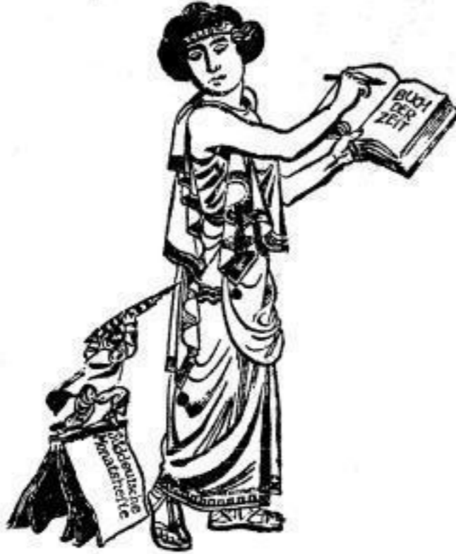
„Der kleine Mann kann mich wohl beschmutzen, aber nicht verhexen!“