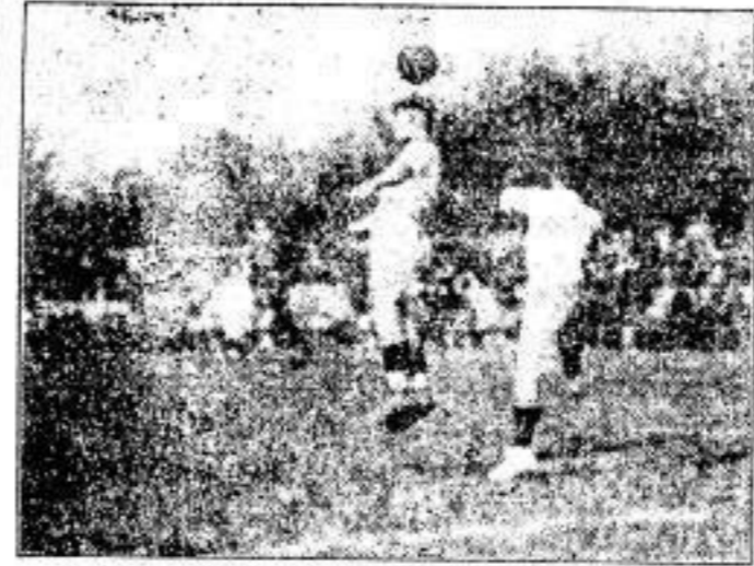
Aus dem Handballspiel-Treffen Schweiz-Deutschland

Turnverein Postental, Bezirk-A. 19. Mai, 7 1/2 Uhr, Versammlung im Gasthof, Mitgliederbuch sind mitzubringen, ohne Bundesbuchmarken kein Stimmrecht!