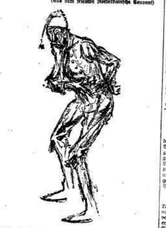
(Aus dem Wochen-Kotterdanks Courant)