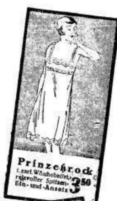
Prinzessrock 3 50 1. zart. Wäscheballst, reifevoller Spitzen- Ein- und-Ansatz