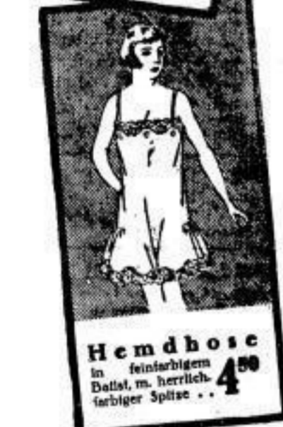
Hemd hose 4 50 in feinstem Ballst, Dattel, m. herrlich- farbiger Spitze . . .