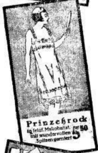
Prinzessrock 5 50 16 zart. Mohobalst, mit wunderschöner Spitze garniert