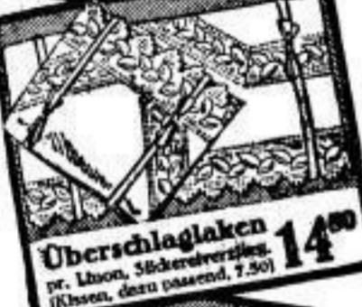
Oberschlaglaken 14 00 pr. Linn, Sticker-Verzierung, (Kissen, dazu passend, 7.50)