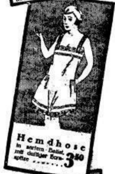
Hemd hose 3 50 in zartem Dattel, mit duftiger Spi- zette