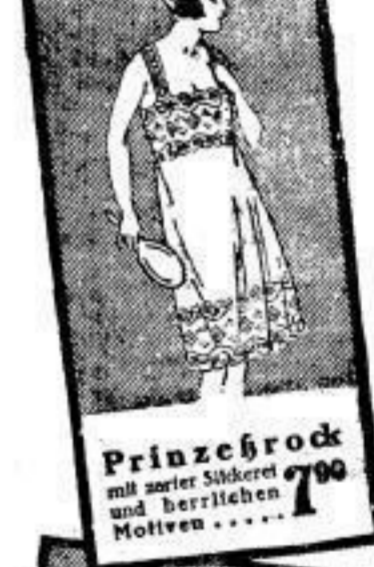
Prinzessrock 7 00 mit zarter Sticker- verzierung und herrlichen Motiven . . .