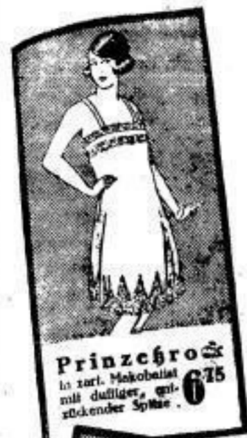
Prinzessrock in zart. Mohobalst mit duftiger, spi- stückender Spitze . . . 6 75

gewährleisten diese außer- gewöhnlich niedrigen Preise