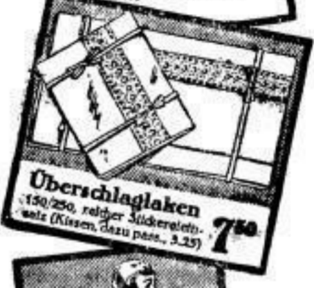
Oberschlaglaken 7 50 150/250, reicher Sticker-Ver- zierung (Kissen, dazu pass., 3.25)