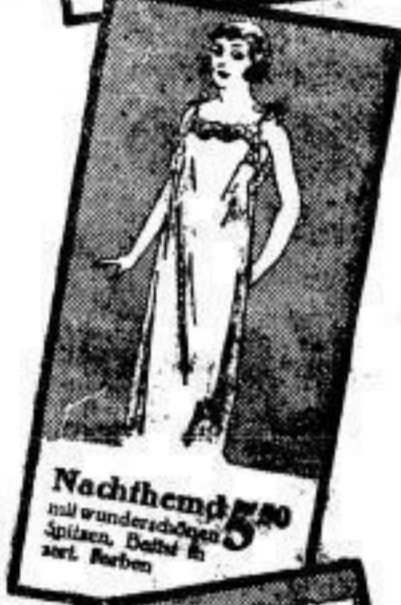
Nachthemd 5 50 mit wunderschöner Spitze, Dattel in zart. Farben