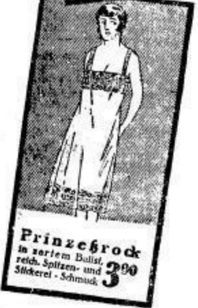
Prinzessrock 3 00 in zartem Ballst, reich. Spitzen- und Sticker- Schmuck

Solides Hemdentuch 45, 80 cm breit, süddeutsche Ware . Meter 60, Mittelstark. Wäschetuch 58, 90 cm breit, kräftige Qualität, besonders für Herrenwäsche . . . . . Meter 95, 75, Erstklassiger Wäschebatist 95, 80 cm breit, in nur süddeutscher Qualitäts- ware . . . . . Meter 1.40, 1.25, 10-Mtr.-Coupon Renforcé 7 50 unsere rühmlichst bekannte Spezialmarke, hochwertige pa. Wäschetuch. Ausnahmepreis