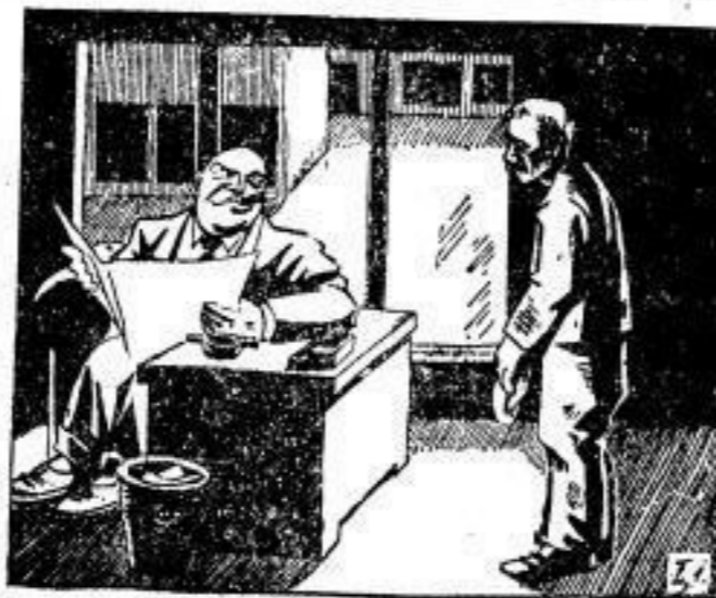
Allein bist du nichts...