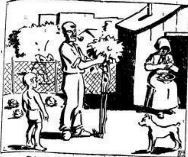
Feierabend nach achtfündiger Arbeitszeit.