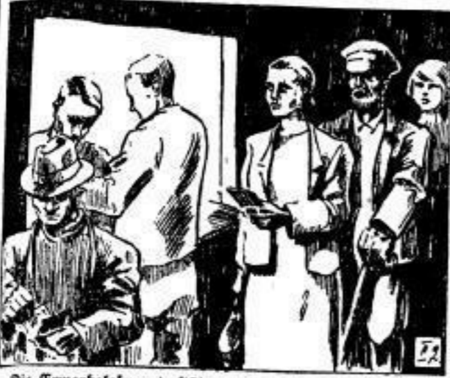
Die Erwerbslosenunterstützung: der Sieg eines gewerkschaftlichen Prinzips.