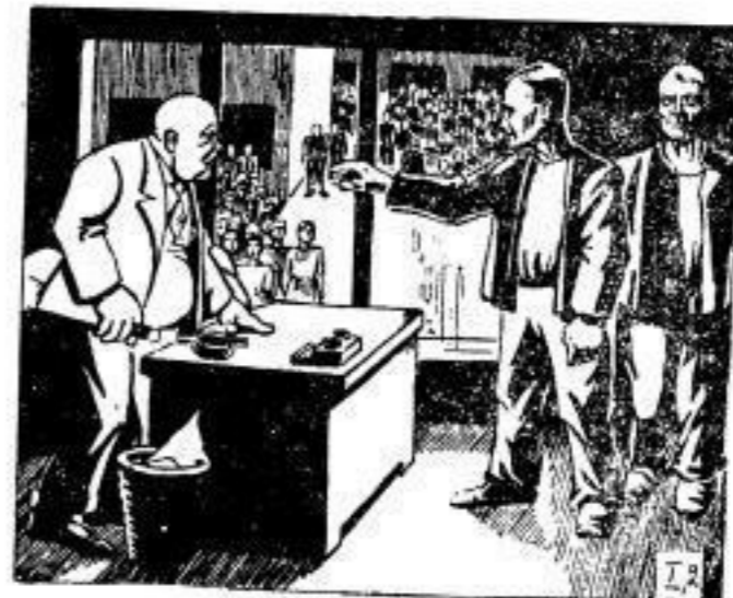
Bereint, eine Macht!