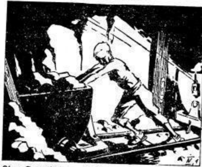
Ohne Gewerkschaften: Kinderausbeutung und Zerstörung der Familie.