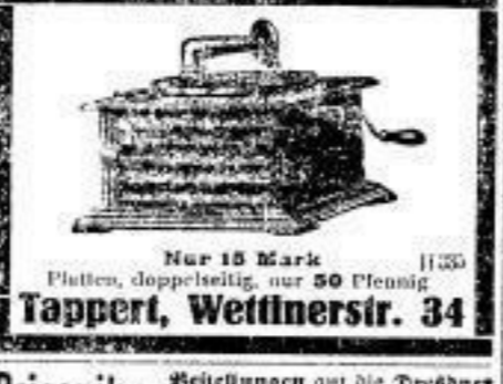
Nur 15 Mark Platten, doppelseitig, nur 50 Pfennig Tappert, Wettinersir. 34

Briesnitz. Bekanntheit auf die Dresdner Volkszeitung wurde sämtliche Literatur nicht entgegen Ernst Melde, städtischer Wettinerplatz