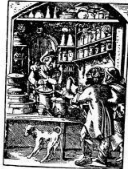
Unter anderem mit dem eingezeichneten das Bild und das...