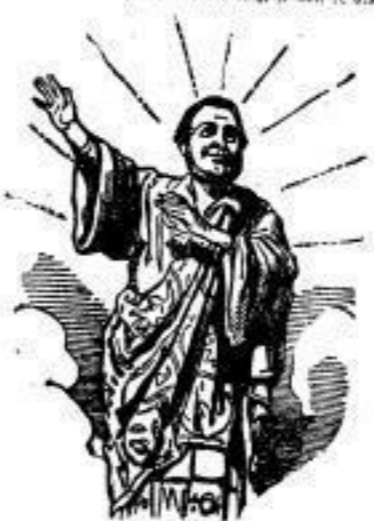
Adolf Glasbrenner nach einer zeitgenössischen Darstellung