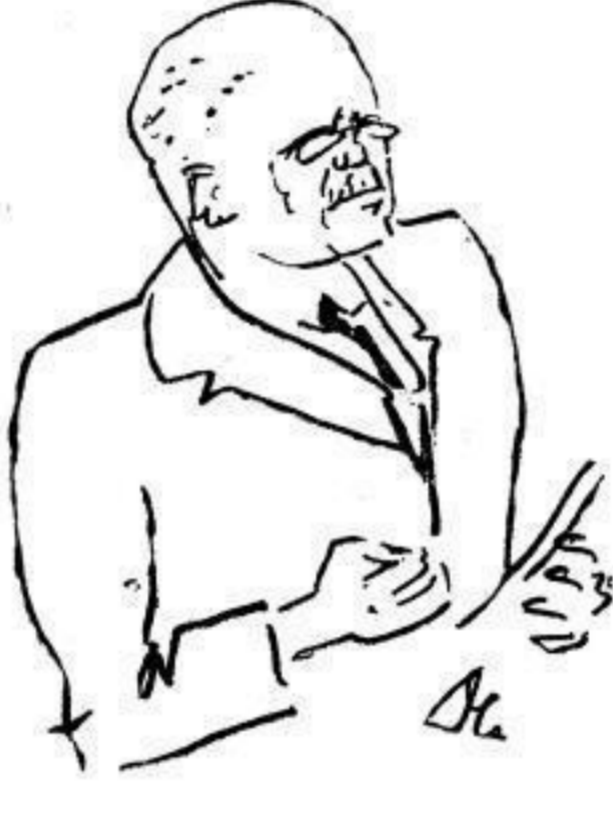
Justizminister Brünger (Deutsche Volkspartei). Es gibt in Sachsen keine Klassenjustiz!