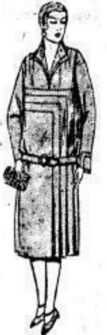
Wollkrapp-Frauenkleid in schwarz mit Crêpe de Chine-Werk und Kragen. Gr. 50 b. 52. 20 00

Auf Pelzmäntel, Pelzjacken, Pelzkragen und Pelzbesätze gewähren wir während unseres Inventur-Ausverkaufs einen Rabatt von 20%