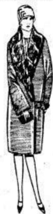
Apart. Mantel, reinw. Ottomane, moderne Wickel, Pelzschal, auf Damasc. gefüttert. 42 00