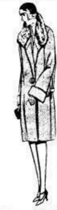
Preisw. prakt. Mantel, reinw. Stoff, versch. mod. Farben flotte Form, Krage u. Pelz besetzt. 7 00