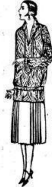
Modern-Frauenkleid, eine in Compostform gehalt. Zusammenst. Für starke Damen. 16 00