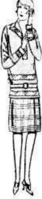
Dasotte Kleid, reinwoll. Stoff, Oberteil ist mit Blenden besetzt, kariertes Rock. 9 00