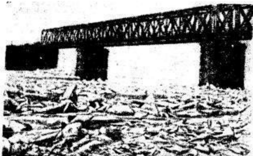
Eisbankung an der Bodebänder Brücke.