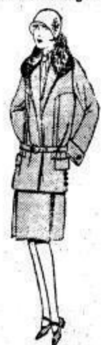
Jackenkl., Orig. engl. Stoff od. Ottomane, Crêpe de Chine gefüttert, Pelz garniert. 58 00 , 75 00 —68 00