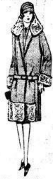
Flotter Mantel reinw. Plausch und Velour versch. Auf schwarz und farbige aus Lager. 14 00