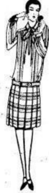
Flottes Kleid aus reinwollonem gestreiften Stoff, Rock mit breiten Falten. Gr. 42 b. 48. 18 00

Lumberblusen od. Pullover f. Dam., Wolle mit Seide, in hellen und dunkleren Farben, mit u. ohne Kragen. 14 00 , 16 00 —