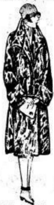
Molliger Mantel, gepreßt, Plüsch (Astrachan) ganz auf Clothfutter, guter Frauentchnitt. 24 00