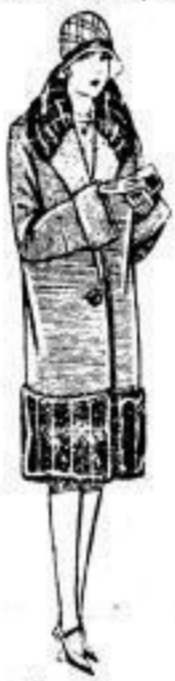
Jugendl. Mantel, Ottomane, schw. u. farb. a. Damasc gest. gefüttert, reich m. Plüsch verbrämt. 29 00