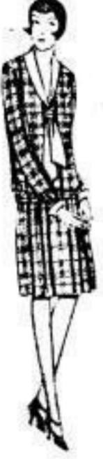
Einjungendeb. Kleid, Pulloverstoff u. flott. Schalkragen, das sehr preiswert ist. Gr. 42 b. 44. 3 00