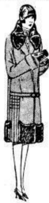
Fescher Mantel, best. Vel. de laine, ganz a. Damasc gest. gefüttert, reich m. Plüsch verbrämt. 39 00