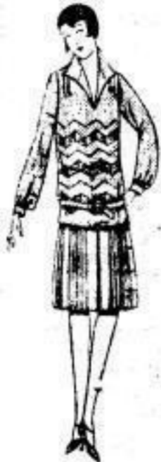
Jugendl. Kleid, dess. Material aus kariert. Wollst. besteht, Oberteil mit mod. Goldstick. 13 00