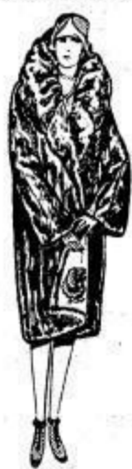
Pelzmantel aus Sealkanistücken auf reiner Seide, m. großem Rollkragen. netto ..... 98 00