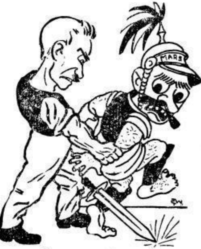
... ist, wenn man diesen pakt!