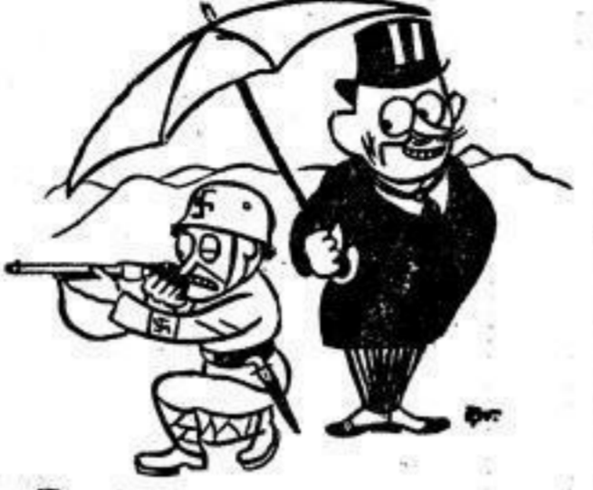
Wer unter dem Schirm des Landrats sitzt, und unter dem Schatten des Gewaltigen schießt, Der spricht zu diesem Herrn: Keine Zuversicht beim nächsten Putsch bist Du, auf den ich hoffe!