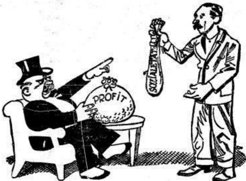
Neue Steuern zur Deckung des Defizits kann die Wirtschaft nicht tragen — die Ausgaben müssen eingeschränkt werden.