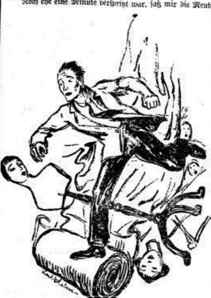
Altenhalben dicht auf den Fersen. Ich war von allen Seiten gehetzt, umstellt, regelrecht wie ein Wild bei der Treibjagd.

die würdigen Bürgerbünde ihre Handschellen entbunden und sich zu schweigenden, bellenden Koppeln zusammenzuschließen!