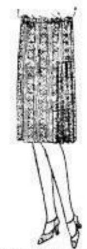
Kleiderrock, Phantasiegew., engl. meliert, helle Farben, seitt. Falten, Knopfschmuck, 12