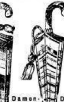
Damen-Schirm, Streif.-M., 16-teilig, 14