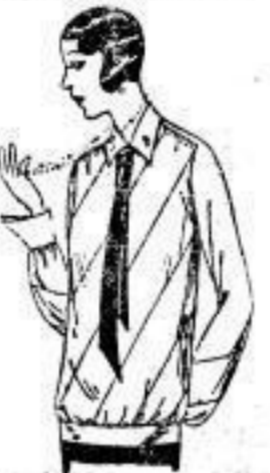
Kasak, Crêpe de Chine, aparte Form, mit Biesen, Crêpe de Chine-Kraw. 22