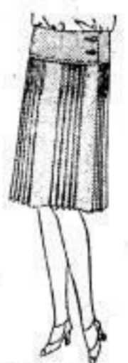
Kleiderrock aus bl. Rips, schmalem Koller, teilweise gesteppte Falten, Größe 42 bis 46, 18