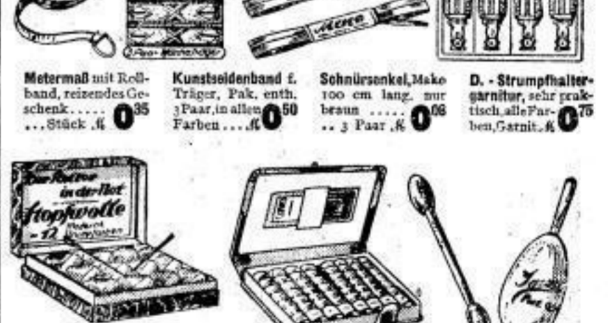
Metermaß mit Rollband, reizendes Geschenk, ... Stück 0,35 Kunstseidenband f. Träger, Pak. enth. 3 Paar, in allen Farben ... 0,50 Schnürsenkel, Make 100 cm lang, nur braun, ... 3 Paar 0,08 D. - Strumpfhaltgarnitur, sehr praktisch, alle Farben, Garnit. 0