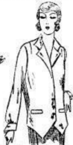
Westenbluse, Crêpe de Chine, sehr modern, in verschiedenen Farb. 19