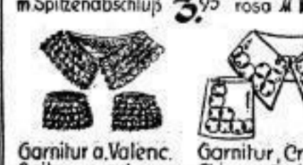
Crêpe de Chine Kragen-Pullover ausschnitt in weiß, tee 1,65 rosa 1,75 Fichû-Kragen, weiß, Spitze m. Spitzenabschluss 3,95 Garnitur a. Valenciennes Spitzen runder Kragen nur ocker 1,75