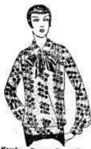
Kasak aus Baumwollmusselin neue Muster, hell- und dunkelbl., Seidenschleife 3