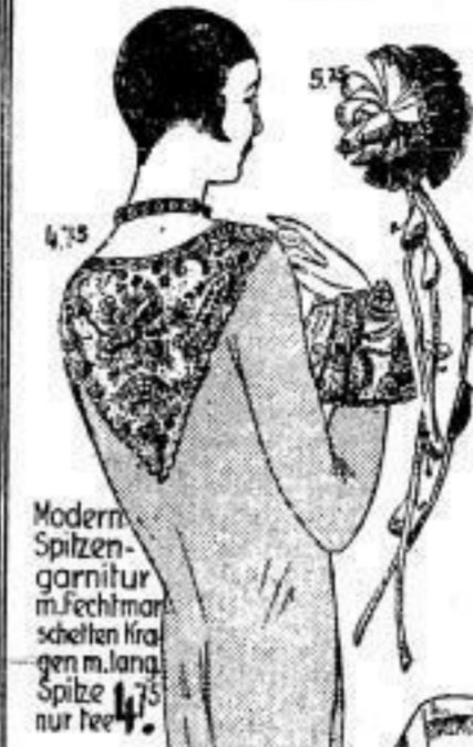
Modern Spitzengarnitur m. Fuchsmantel schellen Kragen m. lang. Spitze nur für 4