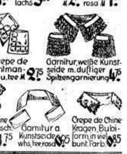
Garnitur, Crêpe de Chine m. Fuchsmantel schette, weiß u. tee 2,75 Garnitur, weiße Kunstseide m. duftiger Spitzengarnierung 4,75 Garnitur, Crêpe de Chine, Garnitur versch. Form, viele Farben M 1,75 Garnitur a. Kunstseide, w/hs tee rosa 1,75 Crêpe de Chine Kragen, Bubi-form, in viel bunt. Farb. 0,85