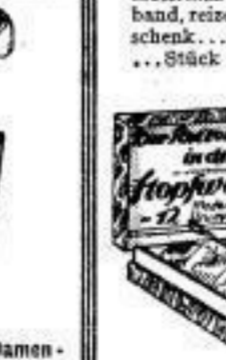
Damen-Schirm, Seide, rötlich, 17

Zahlung kann erfolgen bei Kauf der Ware unter Kürzung von 3% Skonto oder ohne jeden Aufschlag in 4 aufeinanderfolgenden Monatsraten / Unsere Versandabteilung erledigt für auswärt. Wohnende umgehend alle Bestellungen