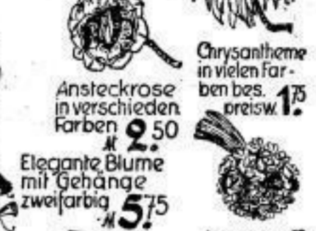
Ansteckrose in vielen Farben bes. 1,75 preisw. 1,75 Elegante Blume mit Gehänge zweifarbig 5,75 Ansteckuff bes. f. Kostüm zarte lila Farbe 4,75