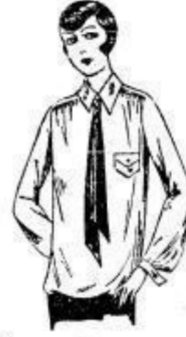
Bluse aus echter Bastseide, Sportf., sehr mod., lange Seidenkrawatte 12