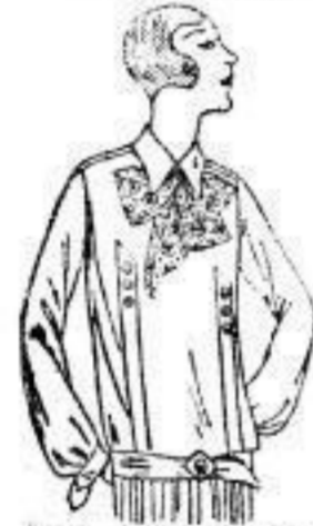
Kasak, Charmeuse, neueste Modelarab., fl. Form, gem. Seid.-Schl. 16