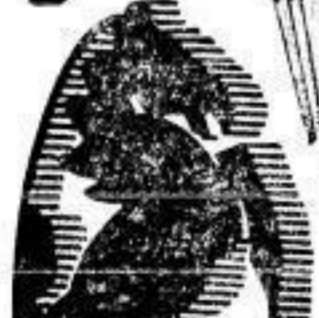
Damen-Schirm, baumw. Bezugsch., br. u. ger. Griff 2