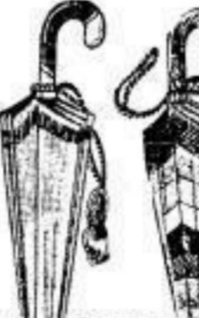
Damen-Schirm, farb. m. K., 12-teilig, 9