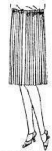
Kleiderrock aus weißem Poperline, ringum modern, feines Plüsch, Gummizug, 10