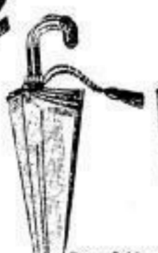
Dam.-Schirm, Halbside, Rundh., schw. br. u. blau, 5