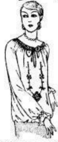
Bulgarenbluse aus weißem Vollwolle mit bunter Handstickerei...K 5