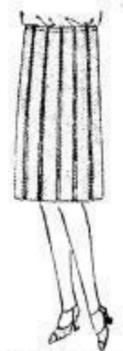
Kleiderrock aus blauem Ripsepopeline, ringum moderne Quetschfalt, Gummizug, 15