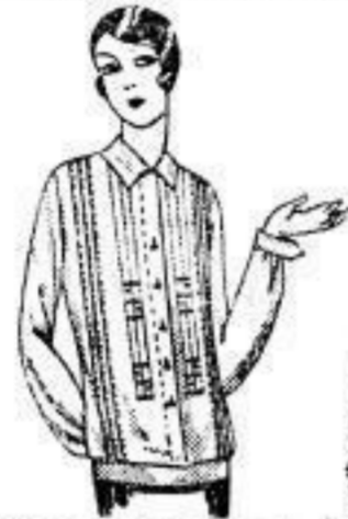
Kasak, reisseid. Toile de soie, Sportform, Falten u. Hohls. in d. Vordert. 17