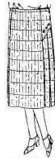
Kleiderrock, braun, meliert. Stoff, weiße Fräusen-Form, seitt. Ansehnung, Falten, Knopfschm., 7