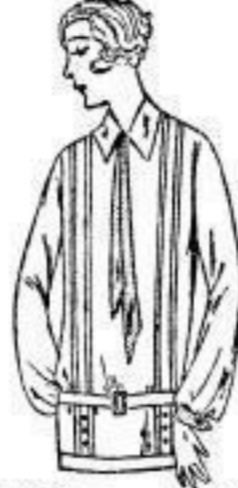
Kasak, Charmeuse, verschied. Farb., Falten im Vorderteil, Gürtel, Krawatte 9