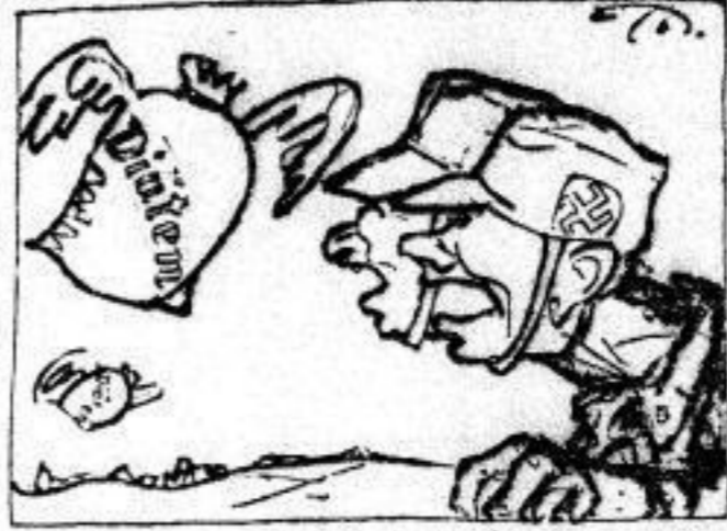
„Hier sieht es fast schon aus wie im Dritten Reich.“