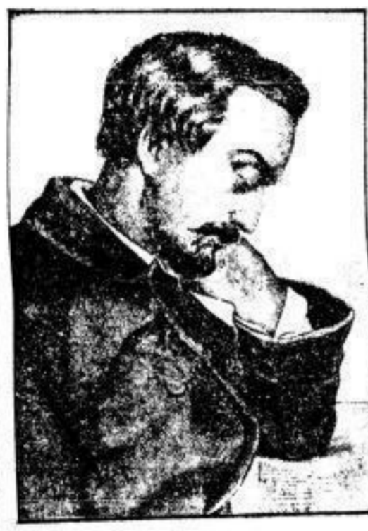
Zum 75. Geburtstag Heines Vor 75 Jahren, am 17. Februar 1855, starb Heinrich Heine...