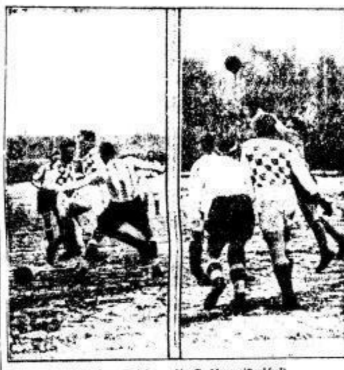
Aus dem Spiel um die Kreismeisterschaft. Der Verbindungsraum hatte schwere Arbeit gegen die Dresdener. Der Hüter von Regau hätte gefährliche Eckballkassen durch lassen.

Der Ruhm der Dresdener kommt nicht den Verdienstes Forman zum Ausdruck, der eine Anzahl der Dresdener auszeichnet. Der Ruhm der Dresdener kommt nicht den Verdienstes Forman zum Ausdruck, der eine Anzahl der Dresdener auszeichnet. Der Ruhm der Dresdener kommt nicht den Verdienstes Forman zum Ausdruck.