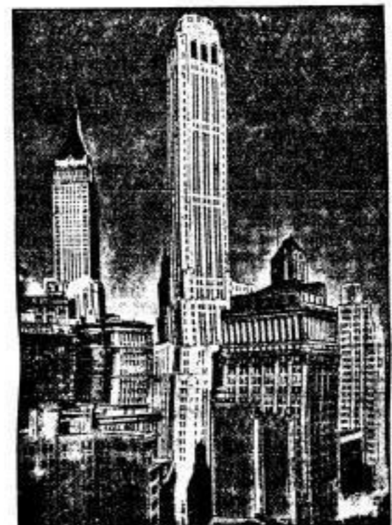
Ein neuer Wollentragerriese im New Yorker Finanzviertel. Das neue Gebäude des Ein Bank Farmers Trust in New York gibt dem Finanzviertel Manhattan wiederum ein neues Gesicht.

So war der schönste Traum, der je geträumt worden ist, und ein der wenigen schönen Nebenprodukte des großen Völkerringens.