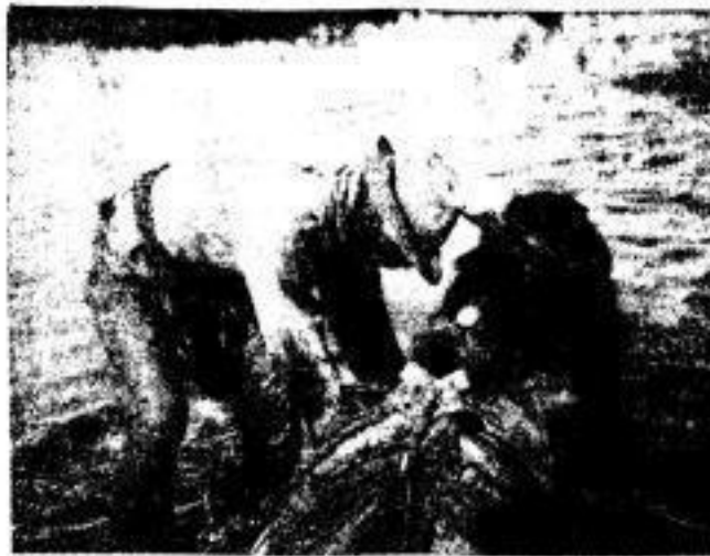
Im der Regenzeit

Ich von ihrer Seite, und sie bleiben sich in deren Felle, genau nach so wie ihre Vorfahren vor vielen tausend Jahren. Wenn aber erst einmal das Wild durch die vorrückende Kolonisation vertrieben ist, dann werden sie der Grundlage ihrer Lebensweise und ihrer ganzen