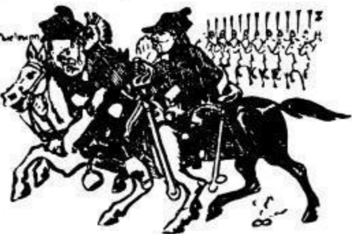
Keine Angst, General Teddy. Der Gaul ist lamm-