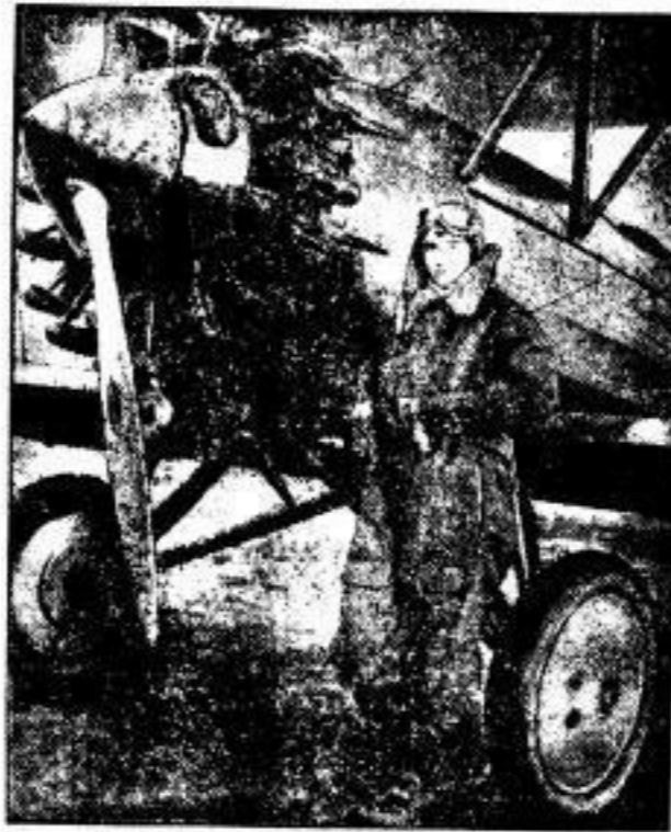
Sie flog einen neuen Weltrekord

Beim Bau der Universität Berkeley (Kalifornien) stürzte das oberste Stockwerk ein. Fünf Arbeiter verunglückten tödlich, 18 lebensgefährlich.