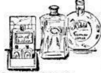
Geschenkpäckung 1 Fl. Köln. Wasser, 1 Fl. Veilchen-Parfüm, 1 Fl. Chypre-Parfüm 0.60 Mundwasser sehr erfrischend, große Flasche 0.95 Haarwachscreme Kamille und Yess, Ia Qualität 0.50