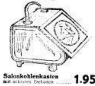
Salonkohlenkasten mit schönem Deckel 1.95

aber während der Vollkragen-Bringung wie ein von ein ganzes Preiswürdigkeit!