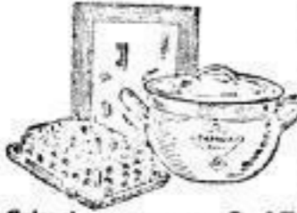
Spiegel breiter weißer Rahmen, 21 x 22 cm. 0.45 Butterdose Glas vierseitig, Diamantmuster 0.50 Schmortopf mit Deckel, grau Emaille, 22 cm Ø 0.95