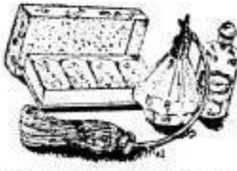
Geschenkkarton Blumenrose, 4 Stck. hochfein parf. 0.65 Zerstücker Buntglas, feiner Scherengaste 1.25 Brillantine große Flasche 0.45