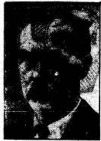
Reformer Revolutionärführer und Generalgouverneur