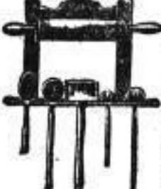
Diese kompl. Holz-Garnitur kostet nur 95 Pf.