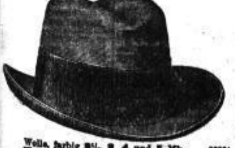
Wolle, farbige 2 1/2, 3, 4 und 5 Mk. Woll, schwarz 1 1/2, 2, 3 bis 5 Mk.