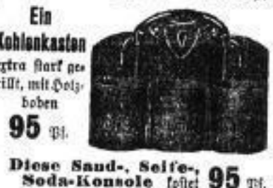
Ein Kohlenkasten extra stark gerüst, mit Holzbohlen 95 Pf.