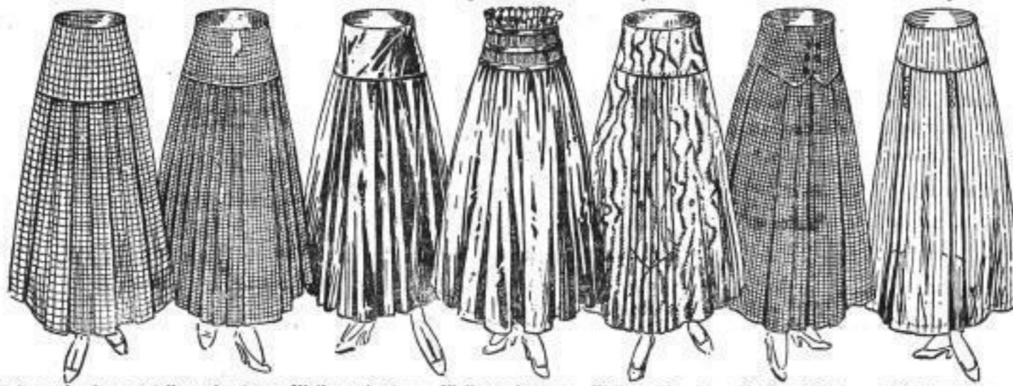
Kleiderrock, schwarz-weiß kar. Sommerstoff, mit Sattel M 8 50 Kleiderrock, schwarz-weiß kar. Sommerstoff, mit Sattel M 7 50 Kleiderrock, schwarz. Seide, mit Sattel, auspring. Falten 24 00 Kleiderrock, schwarz. Seide, geriechen. Sattel u. Blenden 32 00 Kleiderrock, schwarz. gewässerte Seide (Moire) m. Sattel 18 50 Kleiderrock, schwarz-weiß kariert. Wollstoff, mit Sattel 15 00 Kleiderrock, grau und modelarb. reinwoll. Grauerstoff 16 50