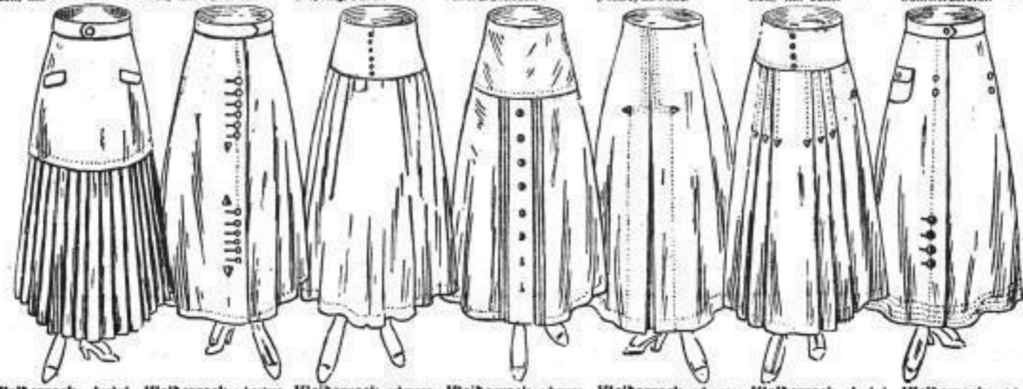
Kleiderrock, dunkelblauer Wollstoff, Sattel m. Taschen 24 00 Kleiderrock, a. bestem dunkelbl. Wollstoff, reiche Knopfverz. 20 00 Kleiderrock, schwarz. Schleierst., Sattel leicht angereicht 22 00 Kleiderrock, schwarz. Stoff (Alpaka) reiche Form, Knopfverz. M 8 50 Kleiderrock, schwarz. Mohlr., m. gestickt. Fliegen verziert 26 00 Kleiderrock, dunkelblau u. schwarz. Stoff, mit Sattel 15 00 Kleiderrock, gut. Lod. uni. weitfallend, sem hochknöpf. 13 50