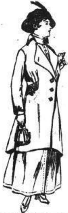
Bieg. Straßen-Jackenkleid , best. geräumt, Cheviot in maullvurf. in grün, reich, Soutach, Jacke a. rein. Seide, Dassen-Glockenrock 148.00