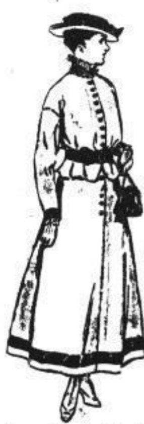
Jugendl. Straßenkleid , neue, hochgeschloss. Form, reich mit Seidenresse garniert u. vellem Glockenrock 78.00