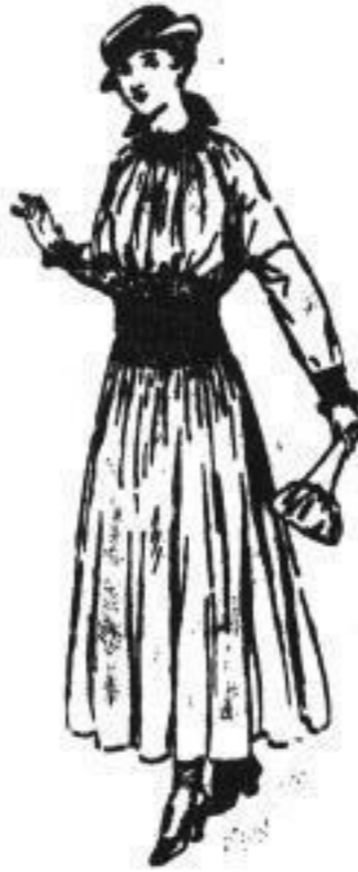
Reis. Nachmitt.-Kleid aus best. Wollkrepp l. schön. Farben, elast. gerieh. Form, sehr kleidsam u. preiswert 51.00