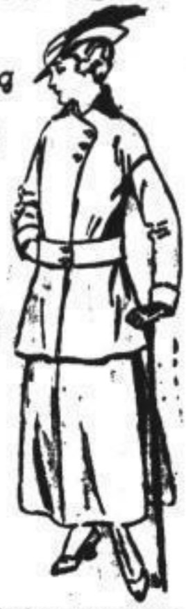
Bäckfisch-Jackenkleid aus grün, marine oder schwarz geräumtem Cheviot, Jacke auf Seiten, Cassen-Glockenrock, sehr protev. 52.00

Damen-Hüte Täglicher Gangan allerletzter Neuheiten