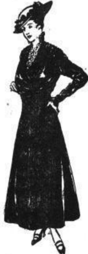
Vornehmes Samtkleid in grün, braun od. schwarz mit reich, Kurbelstick, fein. Spitzen-Schankragen, mod. Glockenrock 83.00