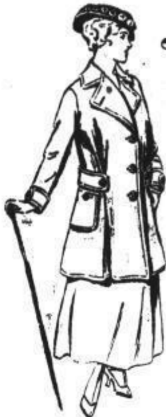
Neuester Glocken-Paletot aus leicht geräumtem Cheviot, in grün, mittelblau od. marine, fesche Körform, off. u. geschl. zu tragen 42.00

Reichste Auswahl einfacher wie elegantester Damen- u. Bäckfisch-Bekleidung in neuesten Formen und Farben