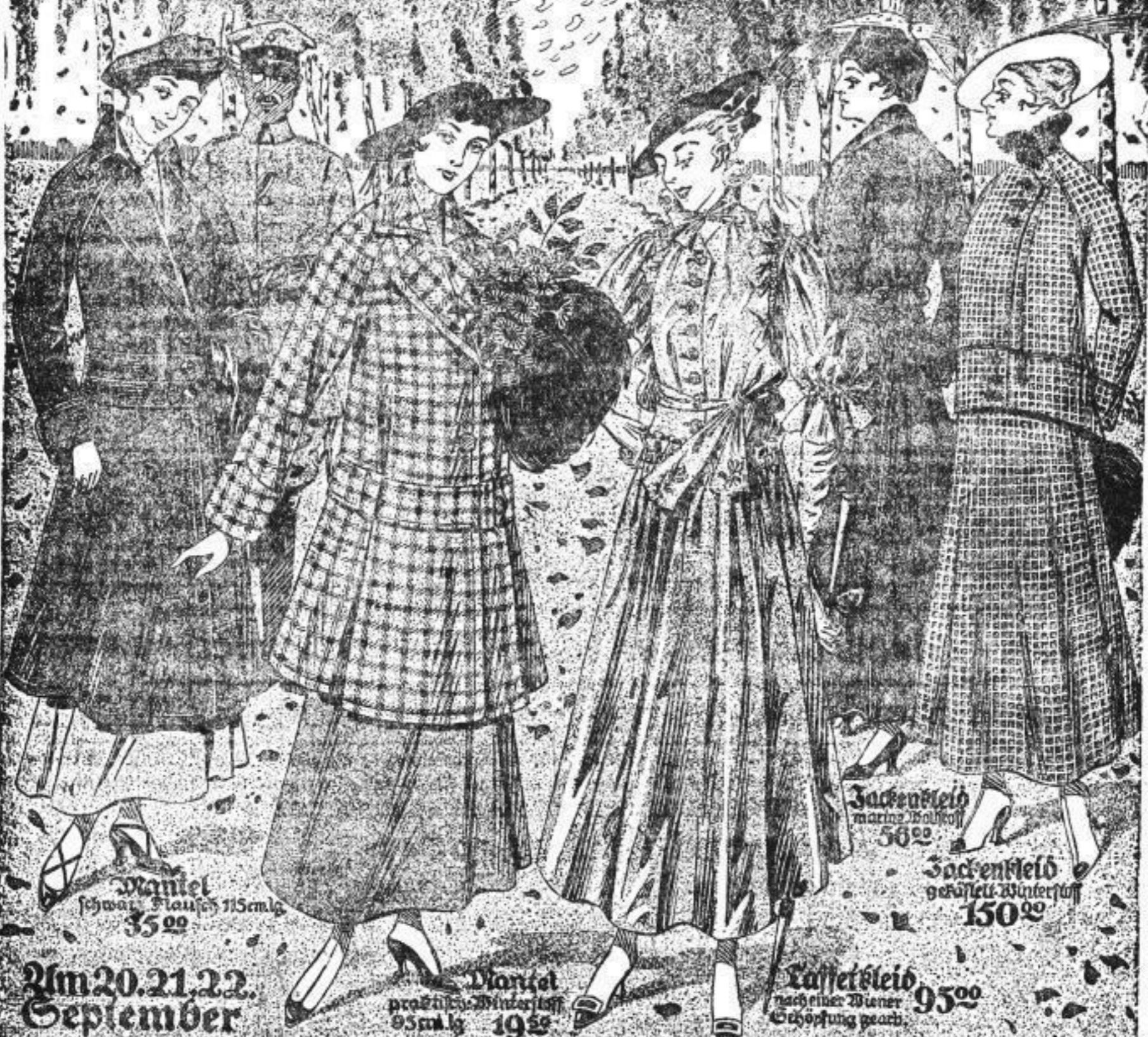
Mantel schwarz, Plausch 115cm lg 35 00