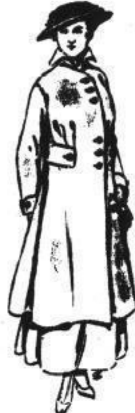
Fescher Winter-Mantel aus best. weich. Flauchstoff, maullvurf. in grün, marine od. schwarz, mod. Glockenform u. Sturkragen 78.00

Eigene Werkstätten m. erstklass. Kräften zur Anfertigung einfacher u. vornehm. Damen-Kleidung