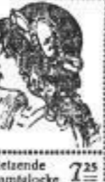
Plüschhut m. 0.90 Seidengarnit. Somitappe l. 5.25 versch. Farb. Sehr preisw. 5.75 Plüschglocke Prakt. Plüsch- 4.50 Südwester Zipfelbappe 5.50 Plüschrand Reisende 7.25 Samtglocke