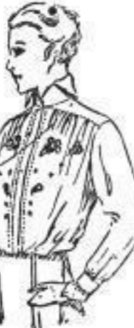
Bluse mit auf feingestrichenem...