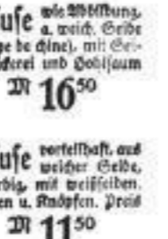
Bluse mit auf feingestrichenem...