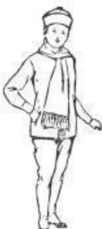
Reis. Model-Garnitur f. Knaben u. Mädchen, bestehend aus Wams, Gamaschenhose, Mütze, Schal, Handschuhen u. mod. Farben. 23,50