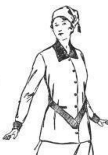
Töckdam. Sport-Garnitur, bestes Material in modern. Pelzungen, einfarb. mit absteckender Kante, neue Gürtelform, flott. Zopfelmütze. 32,50

Um gefällige Beachtung der Schaufenster wird höflichst gebeten.