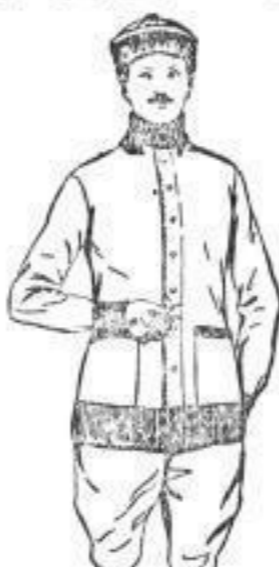
Schwere reinwoll. Herren-Sport-Garnitur, ganz hermetisch u. wasserd., mod. neue Farbensammenst. Wams, Mütze und Handschuhe. 25,50