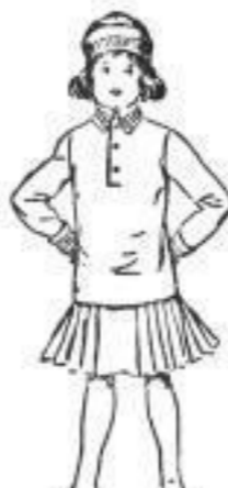
Schickend. Model-Garnitur für Knaben u. Mädchen, weiß u. buntgründig in Würfel, Wams, Mütze, Schal und Gamaschen. 23,00