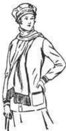
Stotte Sport-Garnitur, bestehend aus Jacke, Mütze, Schal u. Handschuhen, mit hübscher Jacquard-Kante, reine Wolle, sehr preisw. 32,50