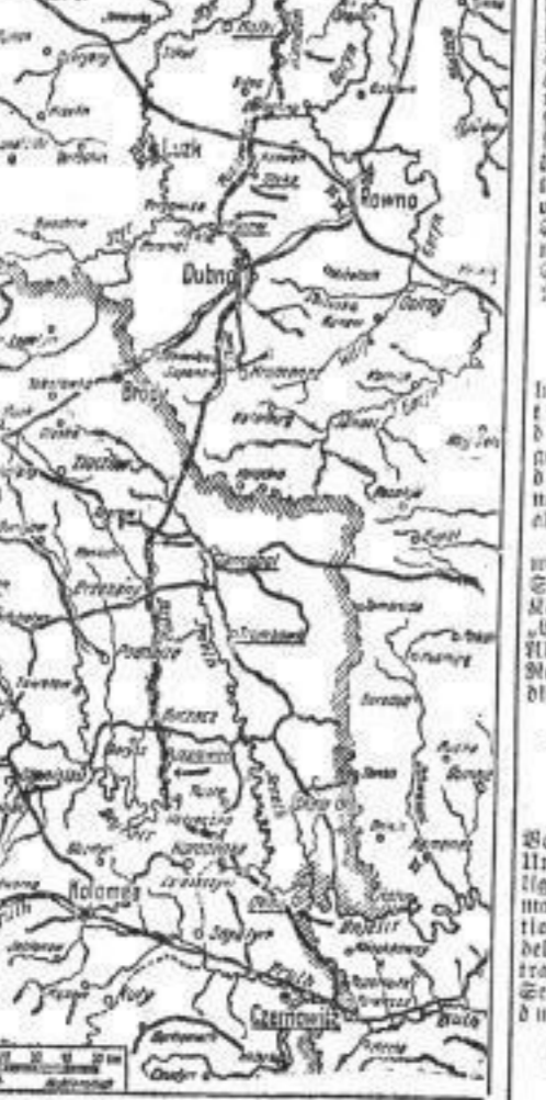
Zur russischen Offensive in Wolhynien und Ostgalizien