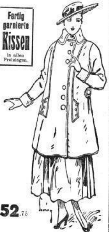
Fertig garnierte Kissen in allen Preislagen.