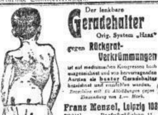
Der lenkbare Geradhalter