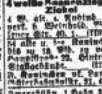
Verkauf ... Pferde-Verkauf