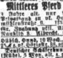
Verkauf ... Pferde-Verkauf