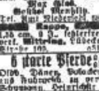
Verkauf ... Pferde-Verkauf