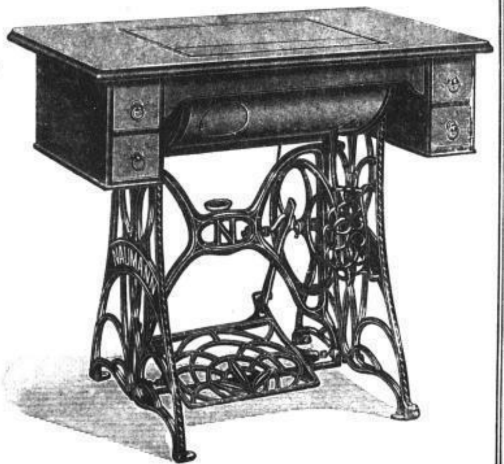
Naumann-Nähmaschine Möbel 6 in vornehmer Ausführung mit versenkbarem Oberteil, Rollverschluß und 4 Schubkästen. Größe der Tischplatte 93×50 cm