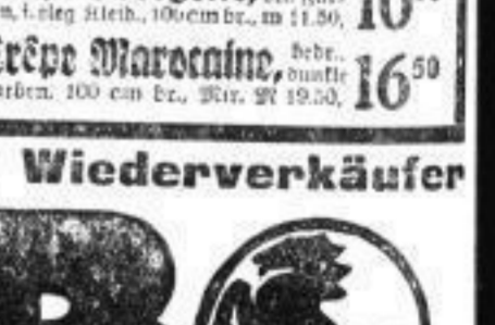
Waldmuller, dunkelblau, in feinen Blüthen, Streifen und Tupeln, 90 cm breit, Meter 2.90 Waldmuller, hellblau, in feinen Blüthen, Streifen und Tupeln, 90 cm breit, Meter 2.10

Unsere Reklame-Abteilung bietet Gelegenheits-Posten für Wiederverkäufer