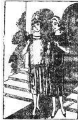
Alle Kleider lieferbar in Längen von 90-115 cm.