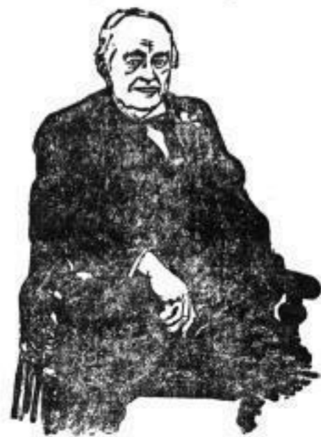
Thomas Alva Edison

feiert jetzt das einzigartige Jubiläum seines tausendsten Patentes, das er in Washington erhalten hat.