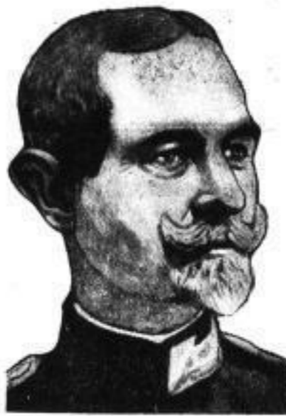
General Kwarocin, der Chef der rumänischen Regierung, dessen Partei bei den soeben stattgefundenen Wahlen eine Zweidrittelmehrheit erzielen konnte.