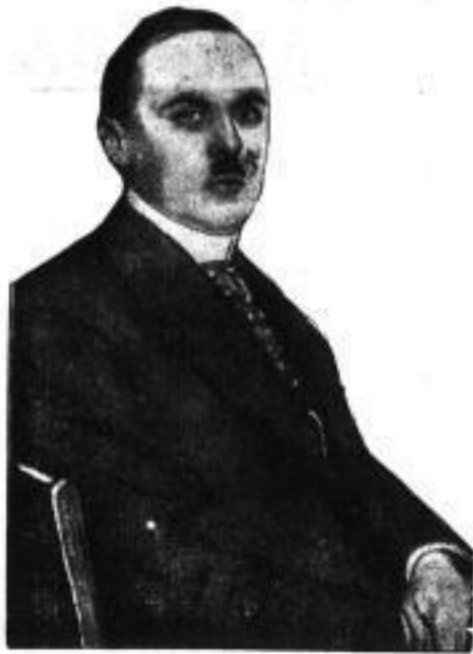
Ministerialdirektor Dr. Berner, der von der Reichsregierung zum Oberreichsanwalt vorgeschlagen wurde.