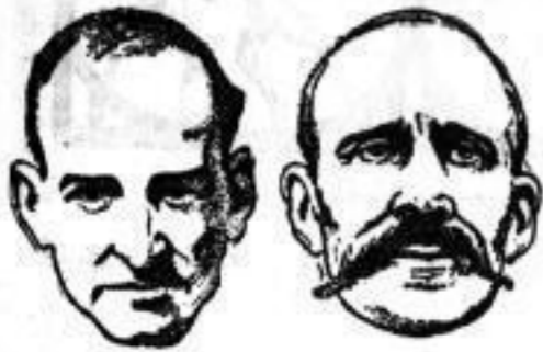
Basca, Banjetti (vgl. die Meldungen auf Seite 1 dieser Ausgabe)