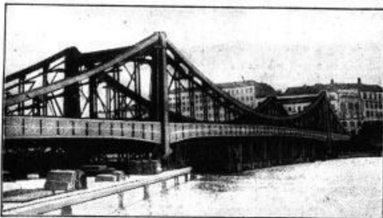
Die neue Hängebrücke

Über dem Humboldtshafen am Lehrter Bahnhof ist nicht nur die größte Hängebrücke Berlins, sondern auch die zweitgrößte in Deutschland. Die 170 Meter lange und 17 Meter breite Brücke hat eine mittlere Durchfahrthöhe von 16 Metern und ein Gesamtgewicht von 2700 Tonnen. Der Entwurf des Bauwerks stammt von Maschinenbauingenieur Cornelia.