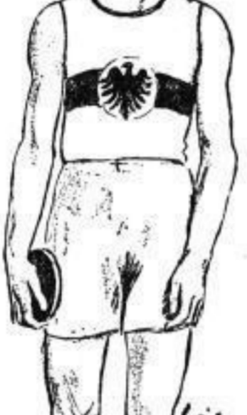
Walter Förster (Diskus)

Der Diskuswerfer Walter Förster hat am 2. Juli in Köln einen neuen Weltrekord im Diskuswerfen aufgestellt. Er warf den Diskus auf eine Distanz von 47,77 Metern.